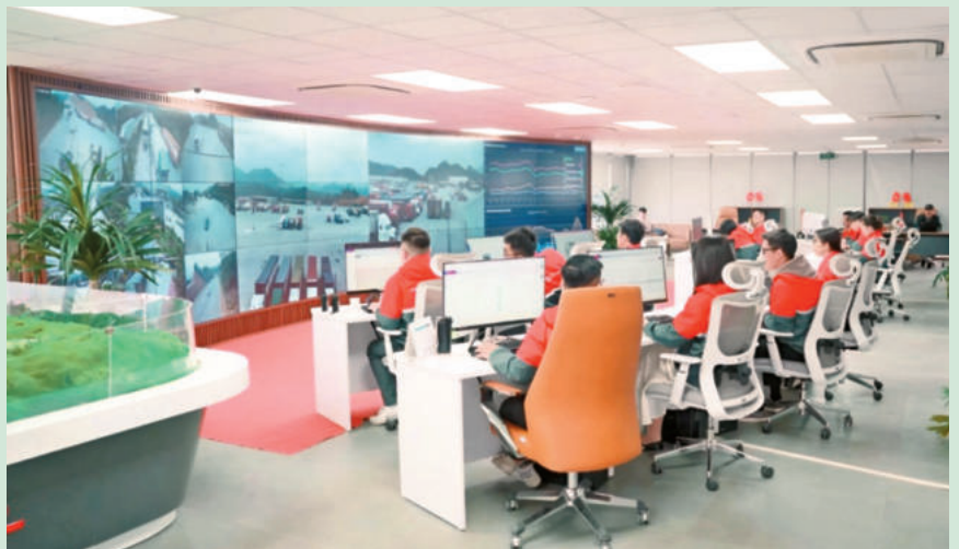
Hệ thống camera AI hỗ trợ trong công tác quản lý điều hành Công viên.The AI camera system supports park management and operations.

Công viên Logistics Viettel bao gồm các phân khu chính: Nhà liên ngành - Trung tâm điều hành NOC, là nơi làm việc của các cơ quan chức năng và trung tâm điều phối toàn bộ Công viên Logistics Viettel, với hơn 2.000 camera AI để giám sát, vận hành. Cổng thông minh (Smart Gate), ứng dụng AI nhận diện biển số, container và sinh trắc học tài xế, giúp tăng tốc xử lý và thông quan gấp 3 lần. Hệ thống X-Ray 6 chiều phát hiện hàng cấm, gian lận mà không cần mở container. Khu sang tải tự động, dùng băng tải telescopic thay cho lao động thủ công, rút ngắn thời gian chuyển hàng xuống còn 30 - 40 phút (so với 3 giờ truyền thống). Khu xử lý thương mại điện tử và chuyển phát nhanh, sử dụng robot AGV, hệ thống DWS và soi chiếu tự động, có thể xử lý tới 600.000 bưu phẩm/ngày; Khu trung bày và