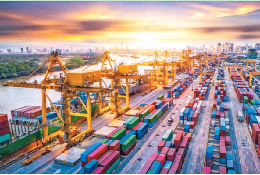
Hoạt động tại cảng cạn và kho bãi chuyên dụng.

kho bãi, vừa rút ngắn đáng kể thời gian chờ đợi (Dwelling Time) – vốn là điểm hạn chế tại các cảng chính. Đặc biệt, với dịch vụ "Một điểm dừng" ( One-Stop Service) tại các cảng cạn, doanh nghiệp có thể hoàn tất mọi thủ tục xuất khẩu ngay tại chỗ, giúp chủ động và tránh được rủi ro trễ tàu do kẹt xe.