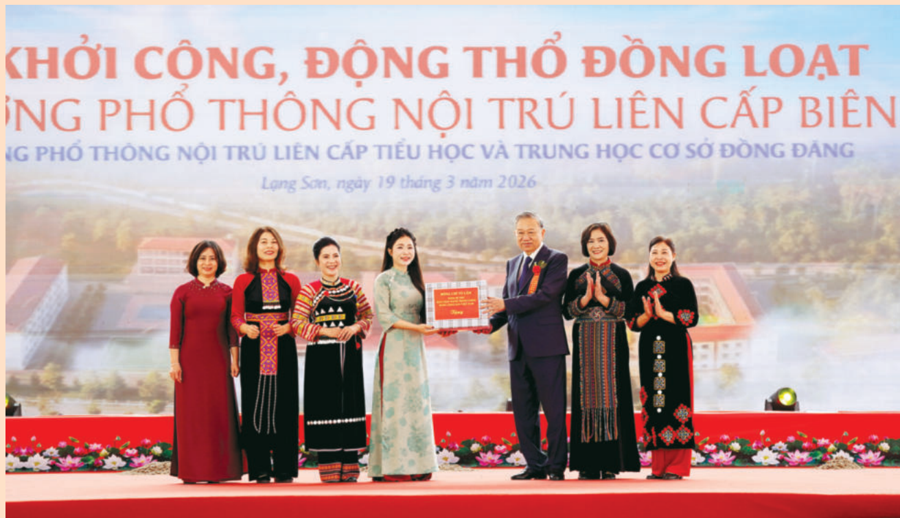
Tổng Bí thư Tô Lâm tặng quà các trường học trên địa bàn xã Đồng Đăng. General Secretary Tô Lam presents gifts to schools in Dong Dang commune.

Ngày 19/3/2026, Bộ Giáo dục và Đào tạo phối hợp với 17 tỉnh biên giới và các đơn vị liên quan tổ chức lễ khởi công đồng loạt 121 trường phổ thông nội trú liên cấp tại các xã biên giới đất liền trong cả nước. Điểm cầu trung tâm được đặt tại Trường Phổ thông nội trú liên cấp Tiểu học và Trung học cơ sở Đồng Đăng, xã Đồng Đăng, tỉnh Lạng Sơn.