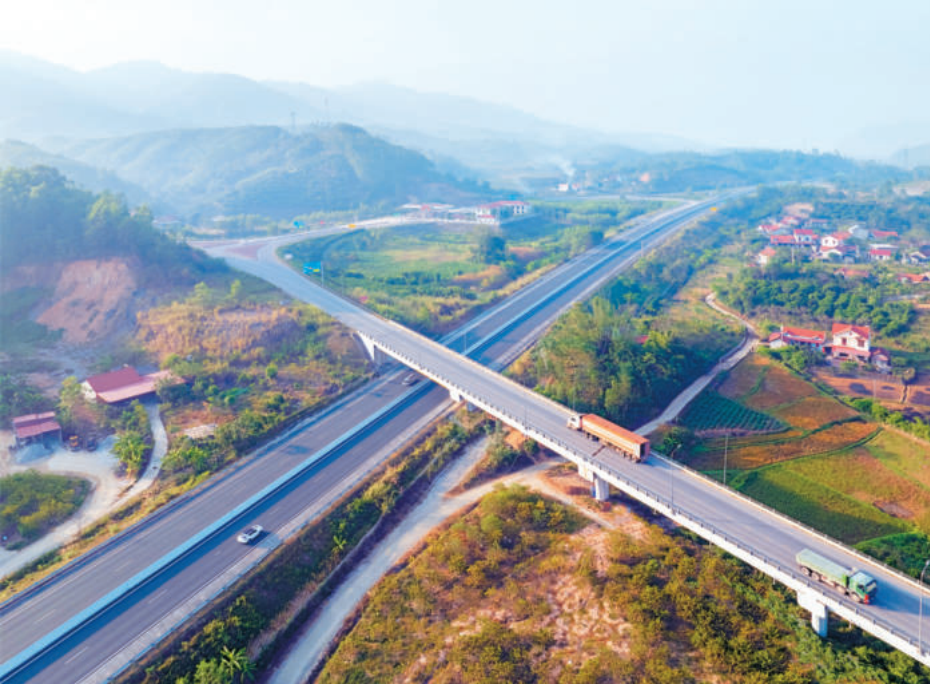
Cao tốc Bắc Giang - Lạng Sơn. Ảnh: BUI THUẬN / Bac Giang - Lang Son Expressway. Photo: BUI THUAN

Tầm nhìn đến năm 2050, Lạng Sơn có nền kinh tế hiện đại, năng động, có hệ thống kết cấu hạ tầng đồng bộ, hiện đại kết nối vùng, quốc tế hiệu quả, hệ thống cửa khẩu hiện đại, xanh, thông minh, an toàn, hiệu quả; là trung tâm kết nối quan trọng giữa các nước Đông Nam Á, Việt Nam với Trung Quốc, Trung Á và châu Âu. Lạng Sơn trở thành vùng đất XANH hấp dẫn đầu tư nước ngoài vào các lĩnh vực, đặc biệt là năng lượng sạch, nông nghiệp, công nghiệp và du lịch. Lạng Sơn đóng vai trò quan trọng trong việc xác định thương hiệu quốc gia của nông sản Việt Nam và là trung tâm quan trọng trung chuyển nông sản, hàng hóa chất lượng cao của Việt Nam và các nước Đông Nam Á đến thị trường khu vực và thế giới. Cơ cấu kinh tế của tỉnh chuyển dịch theo hướng lĩnh vực công nghiệp, dịch vụ, nhất là dịch vụ thương mại, du lịch, logistics và vận tải chiếm tỷ trọng lớn. Các giá trị văn hóa truyền thống được bảo tồn, gìn giữ, phát huy hiệu quả, đóng góp đáng kể vào phát triển kinh tế - xã hội của địa phương. Môi trường sinh thái được bảo vệ; an sinh xã hội của người dân được bảo đảm; trật tự an toàn xã hội, an ninh biên giới, chủ quyền quốc gia được bảo đảm vững chắc.