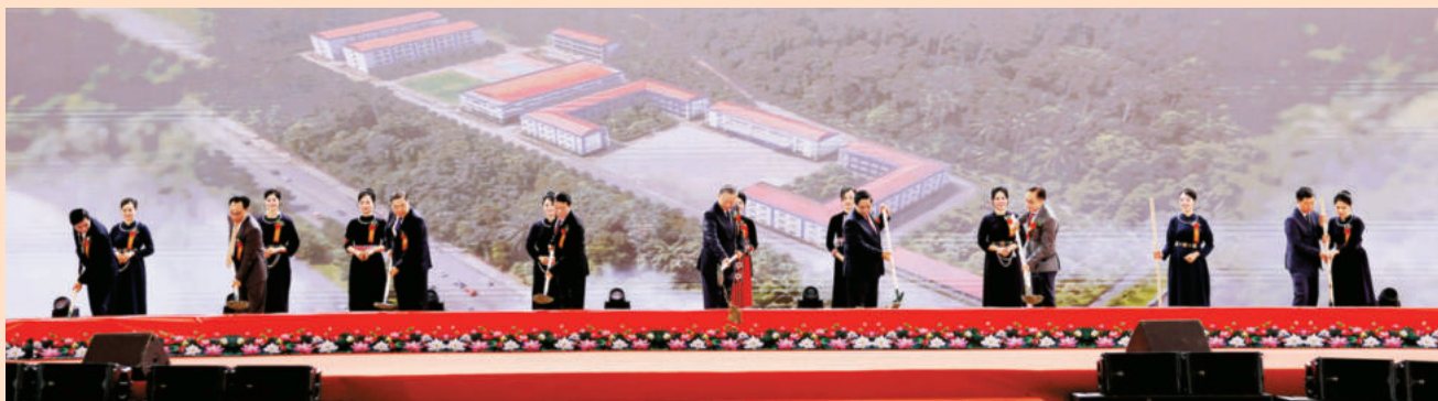
Các đại biểu thực hiện nghi thức khởi công Trường Phổ thông nội trú liên cấp Tiểu học và Trung học cơ sở Đồng Đăng. Delegates perform the groundbreaking ceremony for the Dong Dang primary and secondary boarding school.

In his report, Prime Minister Pham Minh Chinh emphasized that this is a significant event demonstrating the Party and State's commitment to border education for the future of ethnic minority children. According to the Politburo's policy, investing in these schools holds strategic importance, contributing to educational and socio-economic development while ensuring national defense, security, and sovereignty. Following careful preparation, the simultaneous