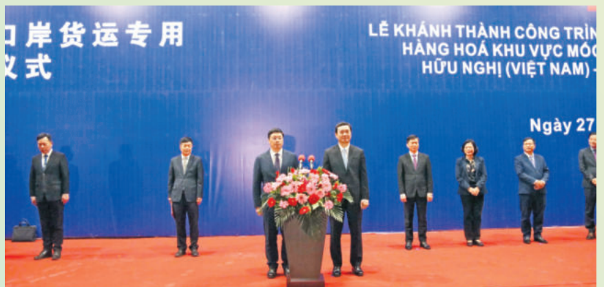
Lễ Khánh thành công trình đường chuyên dụng vận chuyển hàng hóa khu vực mốc 1119-1120 của cửa khẩu thông minh Hữu Nghị (Việt Nam) - Hữu Nghị Quan (Trung Quốc)- tháng 11/2025. / Inauguration ceremony of the specialized commodity transport route at the Huu Nghi (Viet Nam) - Youyi Guan (China) smart border gate area, markers 1119-1120 - November 2025.

Tiêu biểu, việc Công viên địa chất Lạng Sơn được công nhận là Công viên địa chất toàn cầu là dấu mốc quan trọng, đồng thời liên tiếp nhận được Tổ chức Du lịch Thế giới Liên hợp quốc (UN Tourism) công nhận là Làng du lịch tốt