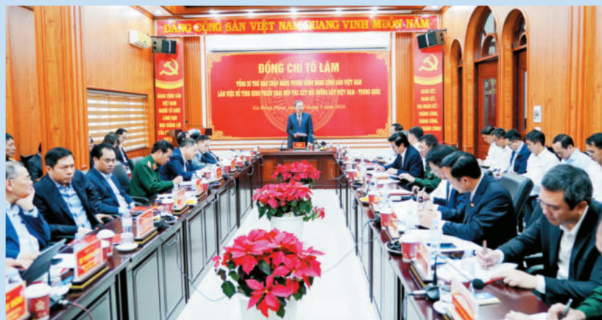
Toàn cảnh buổi làm việc. Overview of the working session.

Sáng ngày 19/3/2026, tại Ga đường sắt quốc tế Đồng Đăng, xã Đồng Đăng, tỉnh Lạng Sơn, Tổng Bí thư Tô Lâm chủ trì buổi làm việc về tình hình triển khai hợp tác đường sắt Việt Nam - Trung Quốc.