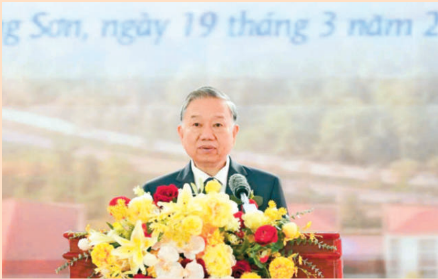
Tổng Bí thư Tô Lâm phát biểu tại buổi Lễ. / General Secretary To Lam delivers a speech at the ceremony.

nước đối với giáo dục vùng biên, vì tương lai con em các dân tộc. Theo chủ trương của Bộ Chính trị, việc đầu tư xây dựng trường nội trú liên cấp tại 248 xã biên giới có ý nghĩa chiến lược, góp phần phát triển giáo dục, kinh tế - xã hội, bảo đảm quốc phòng, an ninh và chủ quyền. Sau khi chuẩn bị kỹ lưỡng, đã tổ chức khởi công đồng loạt 121 trường nội trú liên cấp tại các xã biên giới, nâng tổng số lên 229 trường (cùng với 108 trường khởi