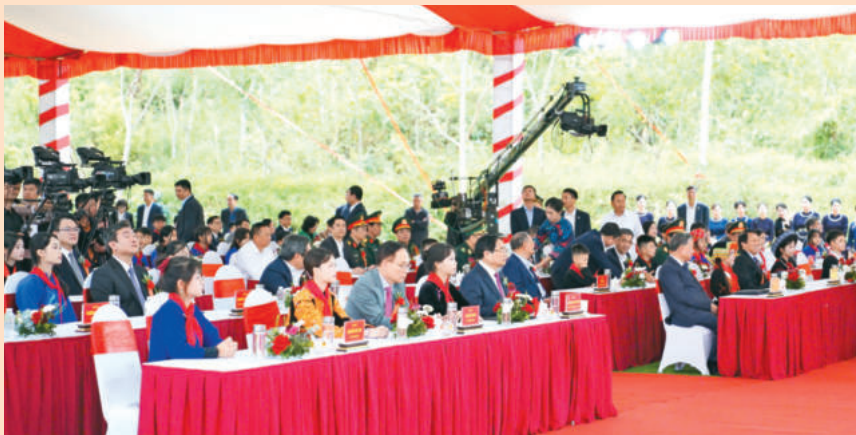
Các đại biểu dự lễ khởi công tại Trường phổ thông nội trú tiểu học và trung học cơ sở Đồng Đăng. Delegates attend the groundbreaking ceremony at Dong Dang primary and secondary boarding school.

Với tinh thần đoàn kết, trách nhiệm của các cấp ủy đảng, chính quyền và nhân dân các địa phương, Tổng Bí thư tin tưởng rằng, Trường phổ thông nội trú liên cấp Tiểu học và Trung học cơ sở Đồng Đăng nói riêng, các trường được khởi công, động thổ xây dựng ngày hôm nay và trước đó sẽ sớm hoàn thành, đi vào hoạt động hiệu quả, trở thành nhiều "Cột mốc mềm" về giáo dục vùng biên, góp phần đào tạo nguồn nhân lực, thúc đẩy phát triển kinh tế - xã hội bền vững và tiếp tục thắp sáng niềm tin cho tương lai vùng biên cương Tổ quốc.