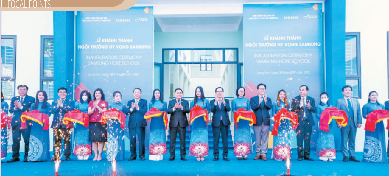
Lễ khánh thành “Ngôi trường Hy vọng Samsung” tại phường Đông Kinh, tỉnh Lạng Sơn - tháng 9/2022. Ảnh: VŨ GIANG /Inauguration of the “Samsung Hope School” in Dong Kinh ward, Lang Son province - September 2022. Photo: VU GIANG

boost exports, attract investment, expand foreign economic cooperation, and explore new potential markets. These efforts have become a primary driver for socio - economic development, progressively affirming the province's position as a strategic trade gateway for the Northern region.