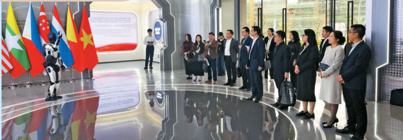
Đoàn công tác của Trung tâm Xúc tiến Đầu tư, Thương mại và Du lịch tỉnh Lạng Sơn thăm Trung tâm Hợp tác ứng dụng AI Trung Quốc -ASEAN, tại thành phố Nam Ninh, Quảng Tây, Trung Quốc. The working delegation from the Lang Son Provincial Investment, Trade, and Tourism Promotion Center visits the China - ASEAN AI Application Cooperation Center in Nanning City, Guangxi, China.

chuẩn bị quan trọng cho Hội chợ Thương mại và Du lịch Quốc tế Việt - Trung dự kiến diễn ra vào tháng