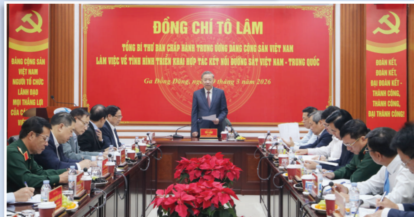
Tổng Bí thư Tô Lâm chủ trì buổi làm việc về tình hình triển khai hợp tác kết nối đường sắt Việt Nam - Trung Quốc tại Ga Đường sắt quốc tế Đồng Đăng, tỉnh Lạng Sơn - tháng 3/2026. / General Secretary To Lam chaired a working session on the implementation of Viet Nam - China railway connectivity cooperation at Dong Dang International Railway Station, Lang Son Province - March 2026.