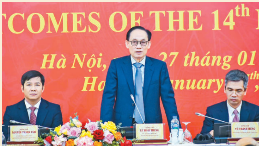
Đồng chí Lê Hoài Trung, Ủy viên Bộ Chính trị, Bộ trưởng Bộ Ngoại giao phát biểu tại buổi Thông báo về kết quả Đại hội lần thứ XIV của Đảng tới các cơ quan đại diện ngoại giao nước ngoài, các tổ chức quốc tế tại Việt Nam.

Với sự quyết tâm của toàn hệ thống chính trị, sự phối hợp chặt chẽ giữa các bộ, ngành, địa phương và lực lượng làm công tác đối ngoại, cùng sự tham gia tích cực của cộng đồng doanh nghiệp và Nhân dân, công tác đối ngoại và hội nhập quốc tế sẽ ngày càng đóng góp quan trọng vào sự nghiệp xây dựng và bảo vệ Tổ quốc, nâng cao vị thế Việt Nam trên trường quốc tế, hướng tới mục tiêu phát triển nhanh, bền vững và hạnh phúc cho Nhân dân.