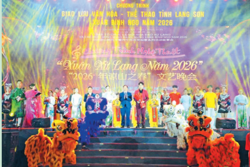
Lãnh đạo Sở Văn hoá, Thể thao và Du lịch tỉnh tặng hoa các nghệ sĩ diễn viên Đoàn Nghệ thuật dân tộc tỉnh Lạng Sơn và Đoàn nghệ thuật Thị Bàng Tường, Quảng Tây, Trung Quốc. The Representative of the Department of Culture, Sports and Tourism presents flowers to Artists from The Lang Son Provincial Ethnic Art Troupe and the Pingxiang Art Troupe.