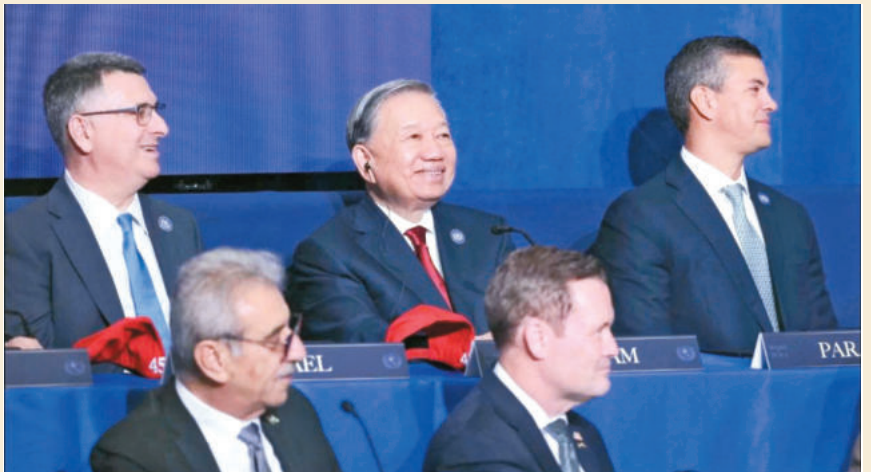
Tổng Bí thư Tô Lâm tham dự cuộc họp khai mạc Hội đồng Hoà bình về Dải Gaza tại Hoa Kỳ - tháng 2/2026.

Để hiện thực hóa mục tiêu, Đại hội Đảng lần thứ XIV nhấn mạnh các nguyên tắc cơ bản trong triển khai công tác đối ngoại: bảo đảm sự lãnh đạo toàn diện của Đảng, quản lý thống nhất của