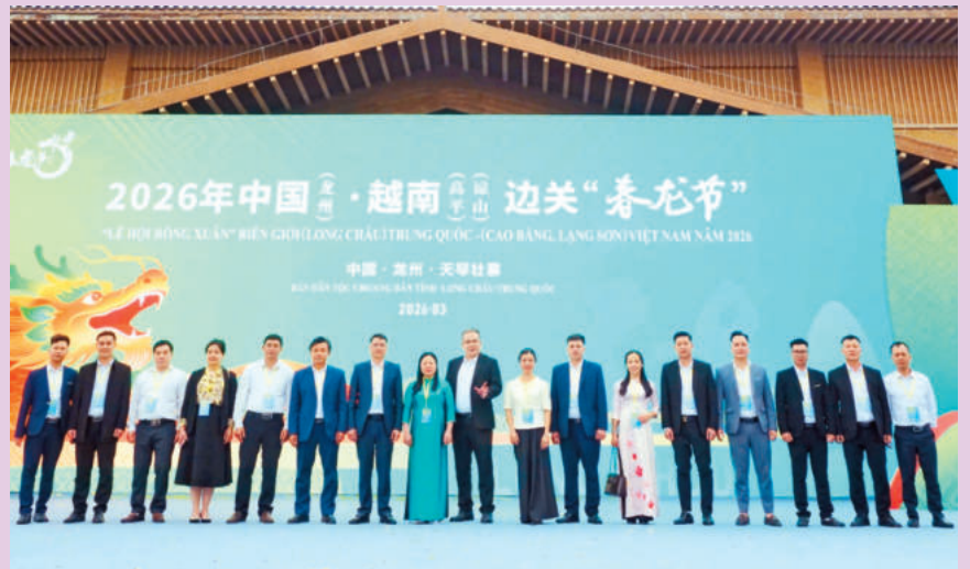
Đại biểu chụp ảnh lưu niệm tại Lễ hội. Ảnh: LÀ VIỆT / Delegates take commemorative photo at the festival. Photo: LA VIET

On March 20, 2026, a delegation from the border communes of Quoc Viet, Quoc Khanh and Khang Chien in Lang Son Province, Vietnam, attended the “Spring Dragon Festival” 2026 in Longzhou district, Chongzuo City, Guangxi Zhuang Autonomous Region, China, at the invitation of the People’s Government of Longzhou district. The program was part of a series of friendly exchange activities aimed at promoting cooperation between border localities of Vietnam and China.