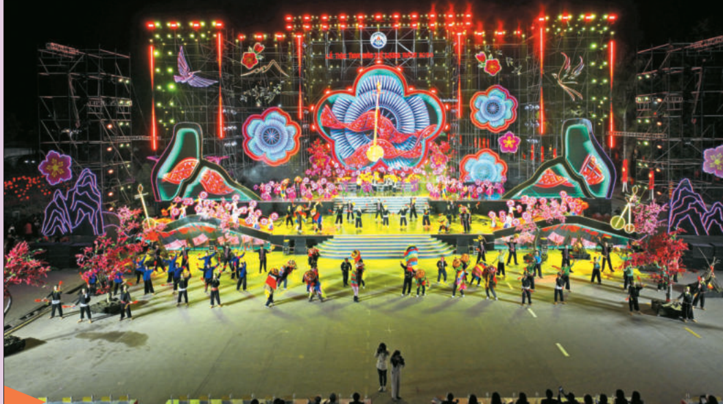
Chương trình Khai mạc Lễ hội Hoa Đào Xứ Lạng năm 2026. Opening ceremony of the Lang Son Peach Blossom Festival 2026.