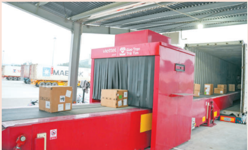
Băng tải tự động telescopic được sử dụng thay thế sức người. Telescopic conveyor belts replace manual labor.

IN DECEMBER 2024, VIETTEL LOGISTICS PARK WAS OFFICIALLY INAUGURATED AND PUT INTO OPERATION AT THE DONG DANG - LANG SON BORDER GATE ECONOMIC ZONE (DONG DANG COMMUNE, LANG SON PROVINCE). THE PROJECT BOASTS A STRATEGIC LOCATION, DIRECTLY CONNECTED TO NATIONAL HIGHWAY 1A, THE HUU NGHI - CHI LANG EXPRESSWAY, THE DONG DANG - TRA LINH EXPRESSWAY, AND THE HANOI - DONG DANG INTERNATIONAL RAILWAY LINE. COVERING AN AREA OF OVER 143.7 HECTARES, VIETTEL LANG SON LOGISTICS PARK IS ONE OF THE MOST MODERN AND WELL-SYNCHRONIZED LOGISTICS CENTERS IN VIETNAM. THE PROJECT PROVIDES A FULL-CHAIN IMPORT - EXPORT LOGISTICS SERVICE SYSTEM, INCLUDING CUSTOMS CLEARANCE, QUARANTINE, INSPECTION, TRANSSHIPMENT, WAREHOUSING, AND CROSS-BORDER TRANSPORTATION, THEREBY ENHANCING CONNECTIVITY AND PROMOTING INTERNATIONAL TRADE ACTIVITIES.