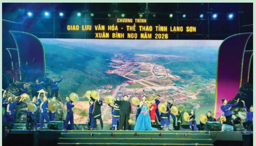
Tiết mục hát múa “Tình hữu nghị Việt - Trung hướng tới tương lai” do các nghệ sĩ, diễn viên Đoàn Nghệ thuật Dân tộc tỉnh Lạng Sơn và Đoàn Nghệ thuật thị Bằng Tường biểu diễn. Artists from the Lang Son Provincial Ethnic Art Troupe and the Pingxiang Art Troupe perform the song and dance “Vietnam - China Friendship Towards the Future”.