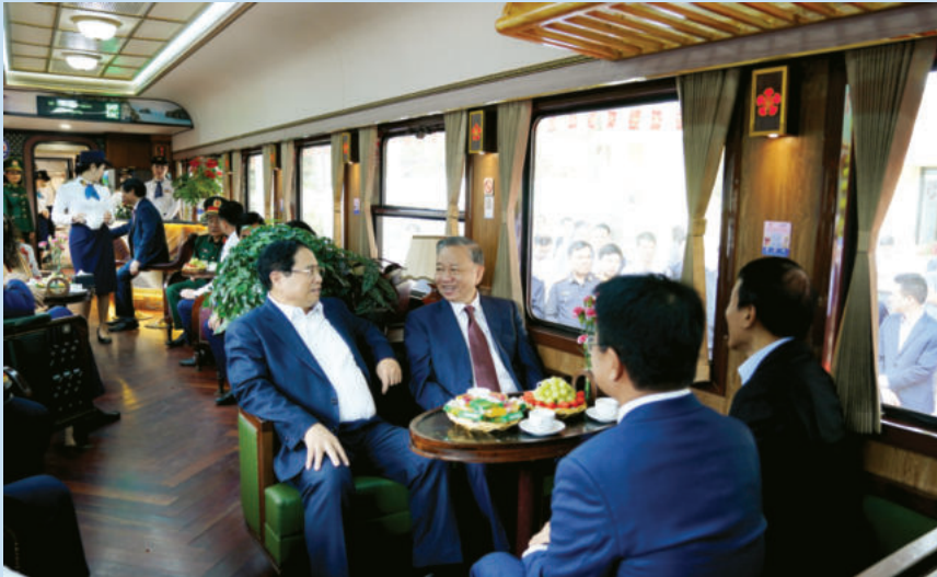
Tổng Bí thư Tô Lâm, Thủ tướng Chính phủ Phạm Minh Chính trải nghiệm chuyến tàu liên vận Hà Nội - Đồng Đăng tại ga Đồng Đăng. / General Secretary To Lam, Prime Minister Pham Minh Chinh experience the Hanoi - Dong Dang in-ternational train at Dong Dang station.

thế của Việt Nam trong chuỗi cung ứng châu Á.