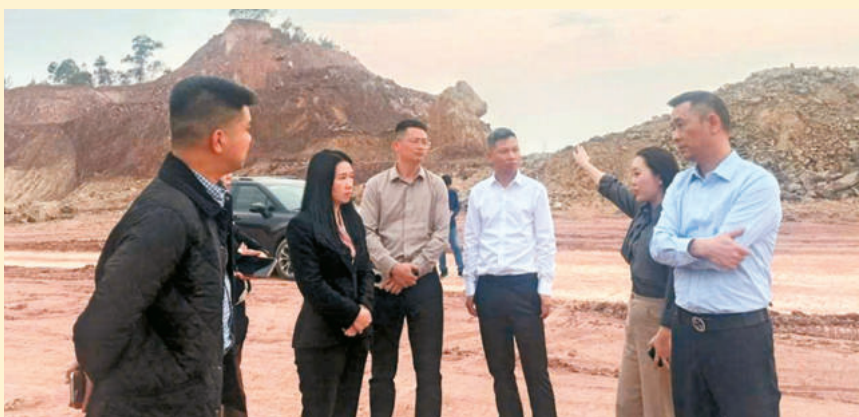
Đoàn khảo sát tại Khu công nghiệp VSIP. The survey delegation at VSIP Industrial Park.

This survey visit aims to further assess the actual conditions while evaluating the feasibility of the cooperation contents discussed during the Group's