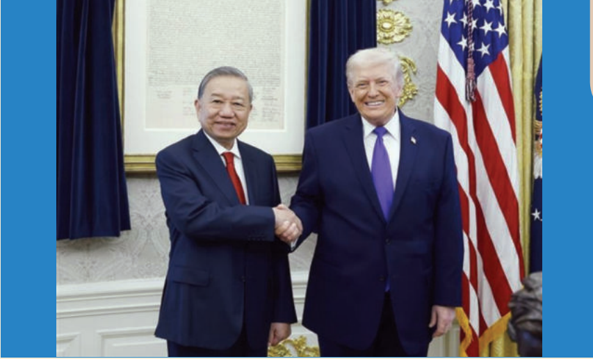
Tổng Bí thư Tô Lâm gặp Tổng thống Hoa Kỳ Donald Trump tại Nhà Trắng nhân chuyến tham dự cuộc họp khai mạc Hội đồng Hòa bình về Dải Gaza.

tâm trong cấu trúc khu vực; xây dựng nền ngoại giao toàn diện, hiện đại