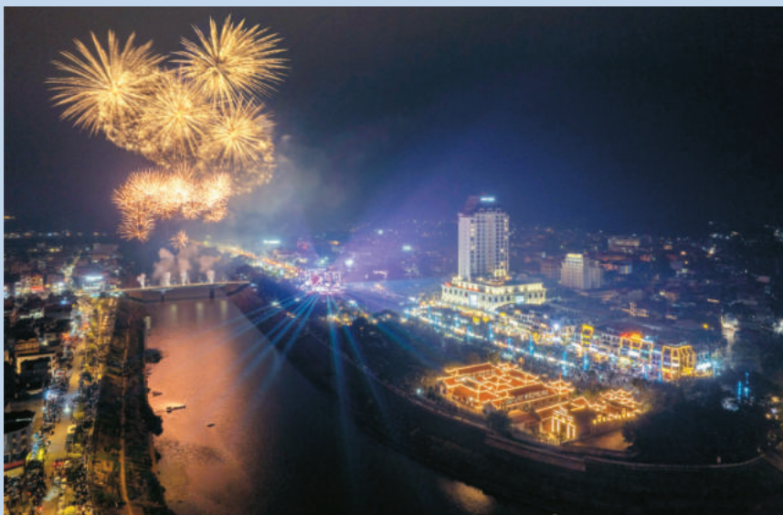
Lạng Sơn bước vào năm mới Bính Ngọ 2026 với khí thế mới, niềm tin mới, quyết tâm mới, thắng lợi mới! Lang Son enters the New Year of the Horse 2026 with new momentum, new confidence, new determination, and new victories!

The development goal by 2030 is to build Lang Son into a border province with a developed economy,