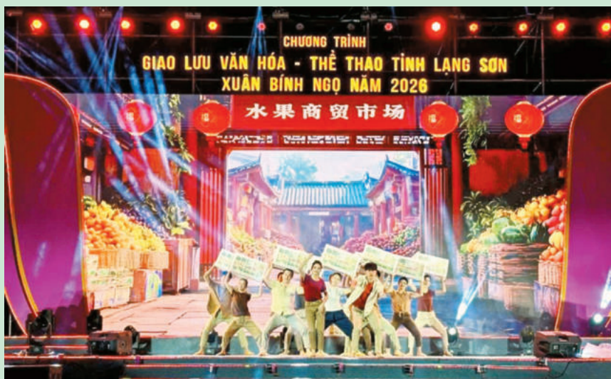
Tiết mục múa “Niềm vui thương mại biên giới” do các nghệ sĩ Đoàn Nghệ thuật thị Bàng Tường, Quảng Tây, Trung Quốc biểu diễn. Artists from the Pingxiang Art Troupe perform the dance “The Joy of Border Trade”.