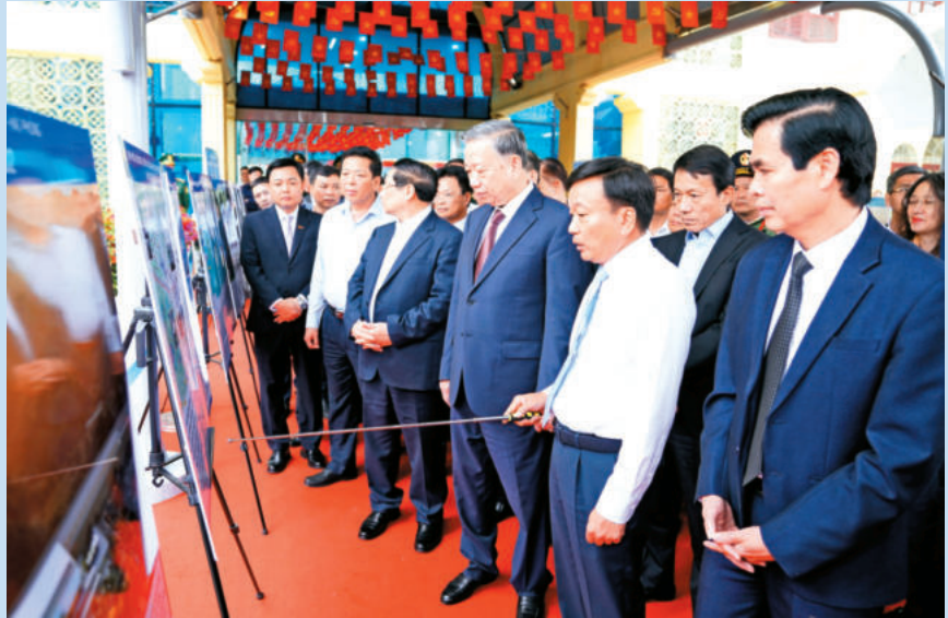
Tổng Bí thư Tô Lâm và Thủ tướng Chính phủ Phạm Minh Chính nghe thuyết trình quy hoạch tuyến đường sắt Hà Nội - Đồng Đăng. / General Secretary To Lam and Prime Minister Phạm Minh Chinh listen to a presentation on the planning of the Ha Noi - Dong Dang railway line.

Developing railway connectivity between Vietnam and China should be regarded as a strategic breakthrough in bilateral economic cooperation and an integral component of Vietnam's strategy for infrastructure, logistics, and regional linkage development in the coming period. It is necessary to establish a unified coordination mechanism at the national level, ensuring centralized leadership