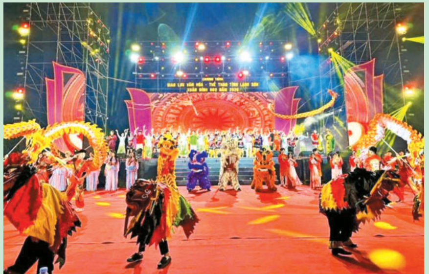
Liên khúc hát múa do các diễn viên Đoàn Nghệ thuật Dân tộc tỉnh Lạng Sơn và Đoàn Nghệ thuật thị Bằng Tường cùng thể hiện. Artists from The Lang Son Provincial Ethnic Art Troupe and the Pingxiang Art Troupe perform a medley of songs and dances.