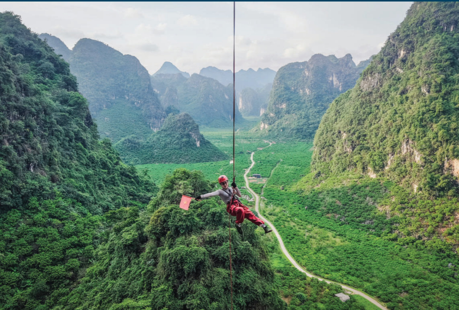
Trải nghiệm du lịch mạo hiểm tại Cổng trời Yên Sơn, xã Cai Kinh, tỉnh Lạng Sơn. / Experiencing adventure tourism at Yen Son Heaven Gate, Cai Kinh Commune, Lang Son Province.

GENERAL SECRETARY TO LAM ATTENDS GROUNDBREAKING CEREMONY FOR MULTI-LEVEL BOARDING SCHOOL IN LANG SON