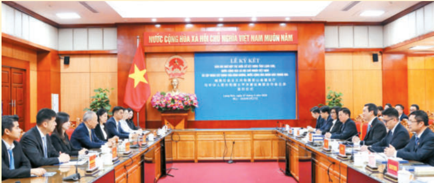
Hai bên trao đổi tại Lễ ký kết. The two sides exchange at the signing ceremony.

Ngày 27/3/2026, tại trụ sở UBND tỉnh đã diễn ra Lễ ký kết Bản ghi nhớ hợp tác giữa Sở Xây dựng tỉnh Lạng Sơn (Việt Nam) và Tập đoàn Xây dựng Thái Bình Dương (Trung Quốc).