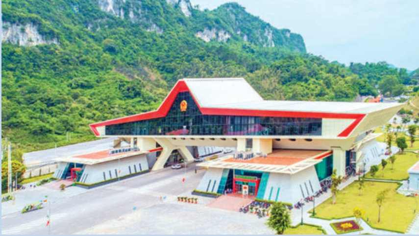
Cửa khẩu quốc tế Hữu Nghị được định hướng phát triển thành cửa khẩu kiểu mẫu ứng dụng công nghệ cao, cửa khẩu thông minh. Huu Nghi International Border Gate is oriented to become a model border gate utilizing high technology and smart border-gate applications.

mate change and achieve sustainable development goals.