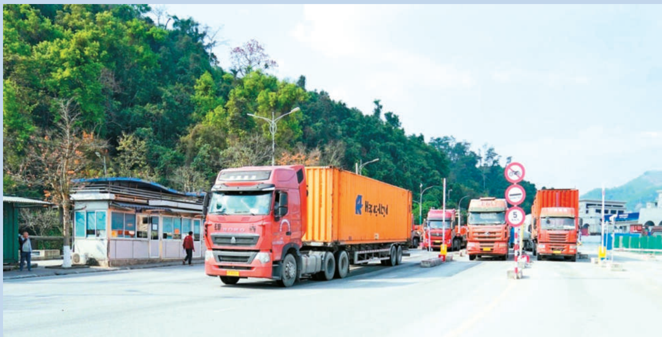
Phương tiện chở hàng hoá xuất nhập khẩu tại cửa khẩu quốc tế Hữu Nghị. Import-export cargo vehicles at Huu Nghi International Border Gate.