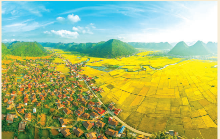
Làng du lịch cộng đồng Quỳnh Sơn, xã Bắc Sơn, tỉnh Lạng Sơn nằm trong vùng CVĐC toàn cầu UNESCO Lạng Sơn được công nhận là Làng du lịch tốt nhất năm 2025. Quynh Son Community Tourism Village in Bac Son, part of the Lang Son UNESCO Global Geopark, recognized as the Best Tourism Village in 2025.

Mục tiêu phát triển đến năm 2030, xây dựng Lạng Sơn trở thành tỉnh biên giới có kinh tế phát triển, xã hội ổn định, quốc phòng, an ninh, môi trường sinh thái được bảo đảm, là một trong các cực tăng trưởng của vùng Trung du và miền núi phía Bắc vào năm 2030, trở