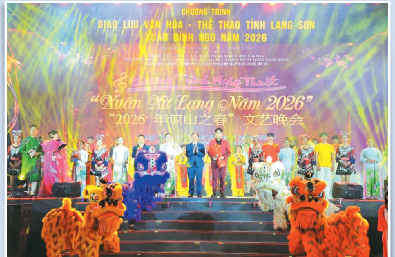
Chương trình giao lưu nghệ thuật "Xuân Xứ Lạng năm 2026" với sự tham gia của các nghệ sĩ, diễn viên đến từ thị Bằng Tường, Quảng Tây, Trung Quốc - tháng 2/2026. Ảnh: LA MAI / Art exchange program "Spring in Lang Son 2026" with the participation of artists and performers from Pingxiang county, Guangxi, China - February 2026. Photo: LA MAI