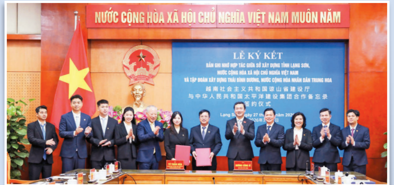
Lễ Ký kết Bản ghi nhớ hợp tác giữa Sở Xây dựng tỉnh Lạng Sơn, Việt Nam với Tập đoàn xây dựng Thái Bình Dương (Trung Quốc)- tháng 3/2026. Ảnh: ĐỖ HOẠT / Signing Ceremony of the Memorandum of Understanding between the Department of Construction of Lang Son Province, Viet Nam and Pacific Construction Group (China) - March 2026. Photo: ĐỖ HOẠT