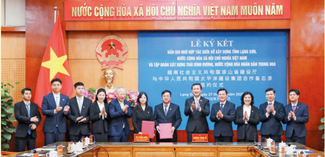
Lãnh đạo hai bên chứng kiến Sở Xây dựng và Tập đoàn Xây dựng Thái Bình Dương ký kết Bản ghi nhớ hợp tác. / Leaders of the two sides witness the Department of Construction and Pacific Construction Group signing a Memorandum of Understanding on cooperation.

On March 27, 2026, at the headquarters of the Provincial People's Committee, a signing ceremony of the Memorandum of Understanding (MoU) between the Department of Construction of Lang Son Province (Vietnam) and Pacific Construction Group (China) was held.