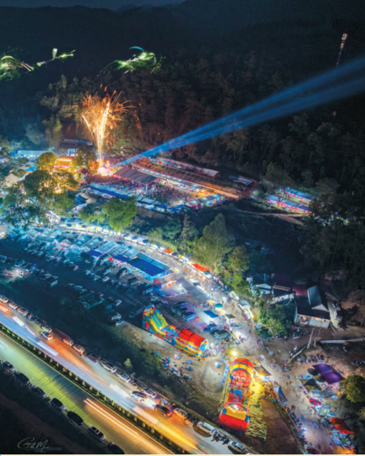
Lễ hội chùa Bắc Nga. Bac Nga Pagoda Festival.

of Lang Son's land and people, but also spread the unique traditional cultural values of local ethnic communities.