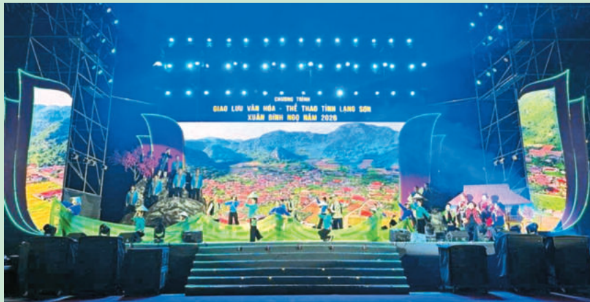
Tiết mục nghệ thuật mở màn chương trình do các nghệ sĩ, diễn viên Đoàn Nghệ thuật Dân tộc tỉnh biểu diễn. Artists from the Provincial Ethnic Art Troupe perform the opening performance.